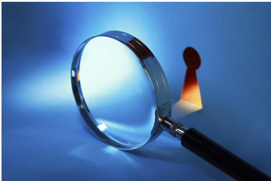
Ilustrație simbol: depositphotos.com/kvkilllov

Pe 12 mai 2017, în colaborare cu portalul Mediaforum.md, am organizat o consultație online pe subiectul aspectelor legale ale filmărilor cu o cameră ascunsă. Prezintă în continuare întrebările pe care le-au pus vizitatorii site-ului și răspunsurile pe care le-am oferit.