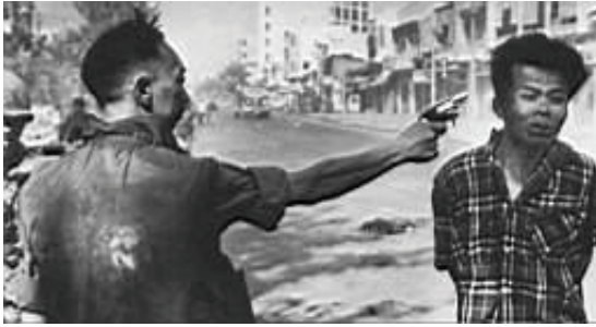
Executarea unui bănuțit la Saigon

Mai multe imagini de un realism dur transmise din Vietnam au condus la reorientarea opiniei publice americane privind războiul purtat de SUA în Indochina.