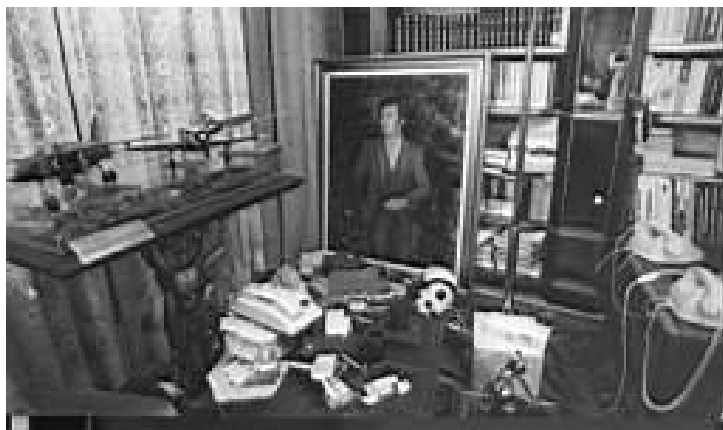
O imagine din locuința lui Nicu Ceaușescu, făcută cu „permisiunea Revoluției”, fotografia a stârnit indignarea maselor.