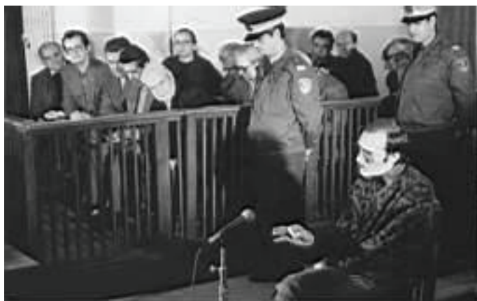
Nicu Ceaușescu în fața justiției. Se vede clar umbra care trădează prezența unor reflectoare de studio. După mai multe intervenții ale apărării, Nicu Ceaușescu a obținut permisiunea de a NU fi fotografiat.

Cu toate acestea, sunt numeroase cazurile în care persoanele antrenate în acțiuni (publice) de protest au protestat... contra fotoreporterului. Ce solicită acești oameni? Ei invocă nedorința de a nimeri în arhivele serviciilor secrete, dar de fapt nu au încă exercițiul legăturii dintre aflarea la manifestație și apariția pe prima pagină a unui ziar. Fenomenul reprezintă, într-un fel, continuarea sentimentului de protecție pe care îl are persoana