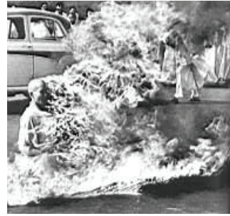
Un călugăr budist și-a dat foc în semn de protest