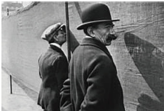
Henri Cartier-Bresson. Undeva pe o plajă, 1932

S-ar părea că optăm cu insistență pentru o „falsă pudoare” în detrimentul unei abordări directe „obiective” a scenei sau a subiectului. Nu este chiar așa. Numai un cinic lipsit de scrupule va fotografia și publica la modul frontal o scenă cu efectele unei tragice sinucideri sau viol. Cinismul și „sângele rece” nu face parte din profesionalism. Nici în reportajul de război sau „puncte fierbinți” cum li se mai zice, tot dintr-un soi de pudoare. În general, fotografia de conflict merită un studiu aparte, fiind probabil și foarte așteptat în mediile noastre jurnalistice. Toate la timpul lor. Acum că am ajuns la finele unei imaginare dispute „Durul” vs. „Samariteanul”, oferim în calitate de „desert” o imagine produsă de magnificul Cartier-Bresson. Este directă sau indirectă, judecați și dumneavoastră. Un lucru este cert: profesionalismul este bun în toate timpurile și pe paginile tuturor ziarelor: